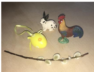
anschauen und merken

Eine andere Variante wäre, dass ihr zu den 2-4 Gegenständen einen neuen Gegenstand dazulegt. Es funktioniert genauso wie oben beschrieben. Dann dürfen die Kinder raten welcher Gegenstand neu dazugekommen ist.