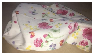
zudecken und wegnehmen