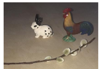
raten? Es fehlt das Ei

Bleibt Gesund und viel Spaß beim Spielen!!!