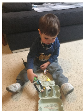
und los geht's